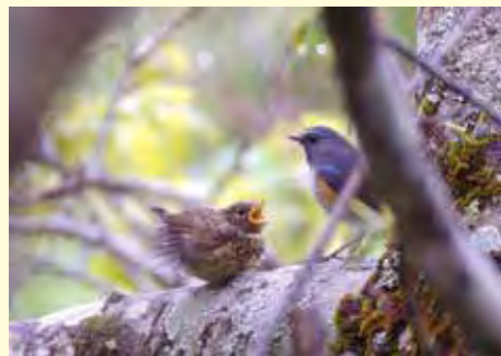
ルリビタキの親子(雲取山)

ヤマドリ、キジ、オシドリ、オカヨシガモ、 カルガモ 、トモエガモ、ホシハジロ、キンクロハジロ、スズガモ、ウミアイサ、 カイツブリ 、 キジバト 、 カワウ 、 ゴイサギ 、 ササゴイ 、 アオサギ 、 ダイサギ 、 コサギ 、 カラシラサギ 、 クロツラヘラサギ 、 バン 、 オオバン 、 ジュウイチ 、 ホトトギス 、 ツツドリ 、 カッコウ 、 アマツバメ 、 イカルチドリ 、 コチドリ 、 セイタカシギ 、 タシギ 、 チュウシャクシギ 、 キアシシギ 、 ソリハシシギ 、 キョウジョシギ 、 オバシギ 、 トウネン 、 ウミネコ 、 コアジサシ 、 ミサゴ 、 トビ 、 ツミ 、 オオタカ 、 アオバズク 、 カワセミ 、 コゲラ 、 オオアカゲラ 、 アカゲラ 、 アオゲラ 、 チョウゲンボウ 、 サンショウクイ 、 サンコウチョウ 、 モズ 、 カケス 、 オナガ 、 ハシボソガラス 、 ハシブトガラス 、 キクイタダキ 、 コガラ 、 ヒガラ 、 ヤマガラ 、 シジュウカラ 、 ヒバリ 、 ツバメ 、 コシアカツバメ 、 イワツバメ 、 ヒヨドリ 、 ウグイス 、 ヤブサメ 、 エナガ 、 オオムシクイ 、 メボソムシクイ 、 センダイムシクイ 、 メジロ 、 オオヨシキリ 、 セツカ 、 ゴジュウカラ 、 キバシリ 、 ミソサザイ 、 ムクドリ 、 トラツグミ 、 クロツグミ 、 アカハラ 、 コマドリ 、 コルリ 、 ルリビタキ 、 イソヒヨドリ 、 サメビタキ 、 コサメビタキ 、 オオルリ 、 スズメ 、 キセキレイ 、 ハクセキレイ 、 セグロセキレイ 、 ビンズイ 、 カワラヒワ 、 ウソ 、 イカル 、 ホオジロ 、 ドバト 、 ホンセイインコ 、 コジュケイ 、 ガビチョウ 、 カオグロガビチョウ 、 ソウシチョウ 、 アヒル 、 アイガモ